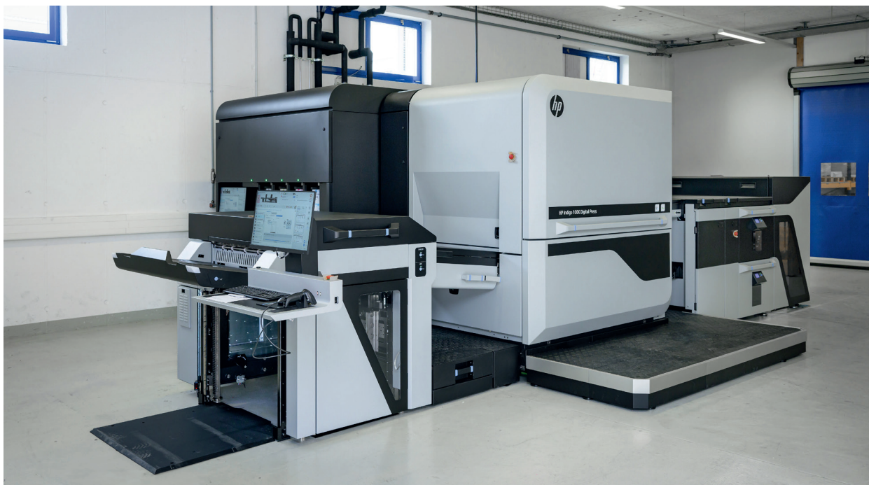
Le 2ème HP Indigo est en service depuis mai 2024